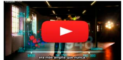
Hans Rosling "The Joy of Stats"

Los datos no son todo. Además de tener datos tenemos que saber cómo plasmarlos. Un excelente ejemplo de esta idea podemos encontrarlo en el siguiente video en el que Hans Rosling nos explica la evolución de 200 países a través de 200 años en relación con la riqueza y con la esperanza de vida. Como bien podemos ver, el trabajo de plasmar los datos de una manera gráfica, sencilla y atractiva es la base fundamental en este tipo de periodismo.