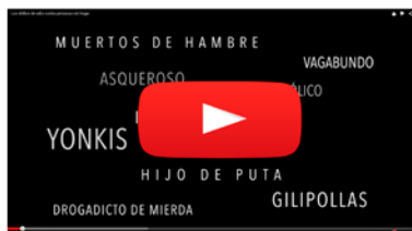
Observatorio Hatento "Los delitos de odio contra personas sin hogar"

En esta propuesta queremos destacar que la iniciativa surge de un trabajo en red, de una unión de organizaciones. La preocupación compartida por una situación tan dolorosa, la necesidad de encontrar respuestas y de visibilizar esta realidad son las que han posibilitado el estudio. El hecho de unir fuerzas ha supuesto en este caso ser capaces de conseguir, no ya una dimensión mucho más amplia en el estudio, sino también una repercusión que de otro modo habrían sido imposibles de conseguir desde cada una de las organizaciones.