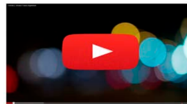
Documental "Carmen y Jimena. Futuro Imperfecto"

Nos encontramos en unas sociedades complejas e interconectadas. Cuando hablamos de la situación de las mujeres maltratadas, de la realidad del África subsahariana, de las y los menores empobrecidos en nuestros